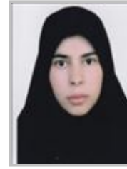
السادات سادات حسینی گروه فاطمه