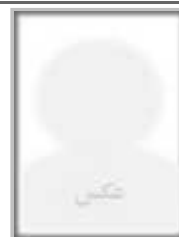
السادات عمرانی نسب فاطمه